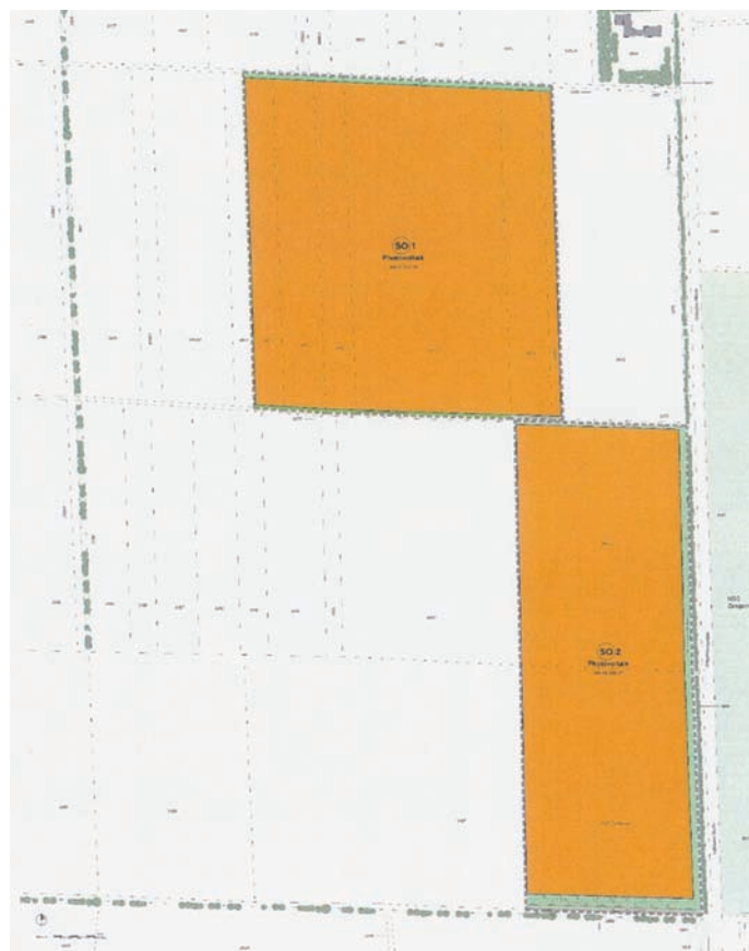
Ausschnitt: Entwurf des vorhabenbezogenen Bebauungsplans Nr. 52 „Freiflächen-Photovoltaikanlage Zengermoos“