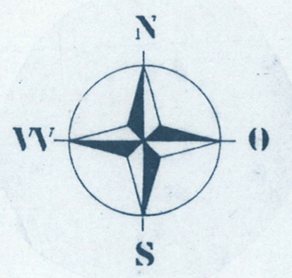
LAGEPLAN M 1:1000